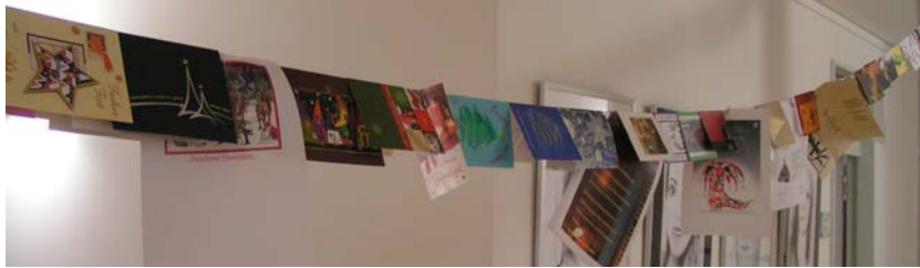
ein kleiner Ausschnitt aus der langen Grußkette

Alle Jahre wieder erfreuen wir uns über die vielen verschiedenen Weihnachtsgrüße , die in unserem langen Verwaltungsgang ihren Platz finden.