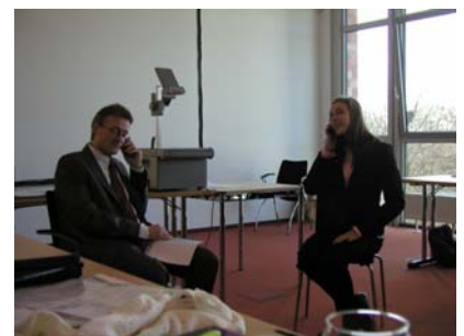
Foto: Herr Radermacher stellt mit einer Schülerin ein Bewerbungsgespräch nach.

Jeweils 6 Stunden lang gab die VRT Tipps für die berufliche Zukunft sowie praktische Hilfestellung bei der Vorbereitung künftiger Bewerbungsgespräche.